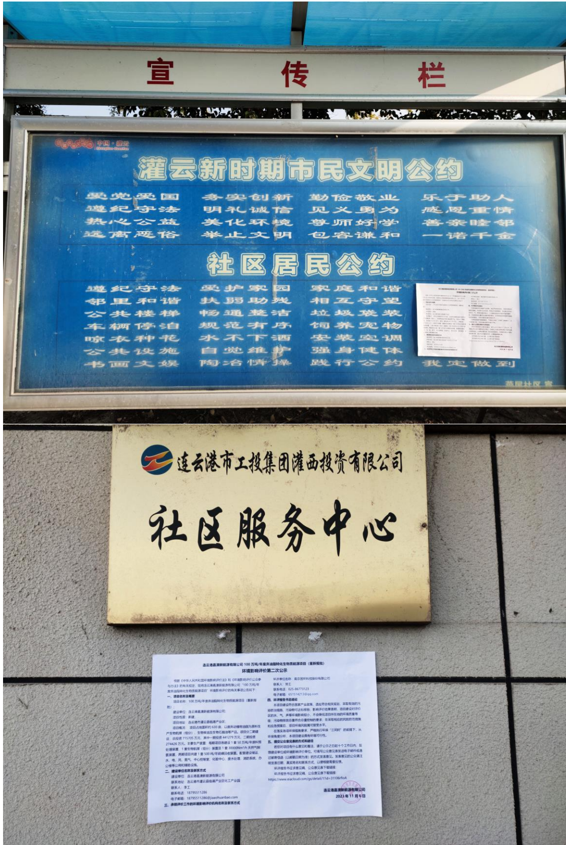
图 3.2-3 现场公告照片