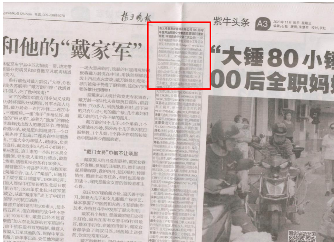
图 3.2-2 报纸公示照片（两次）