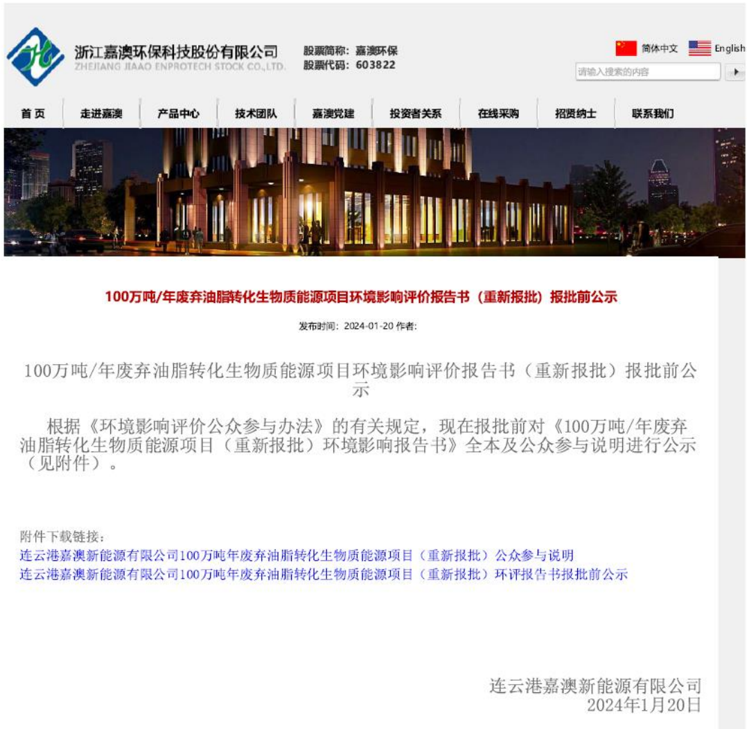
图 6.2-1 报批前公示网络截图